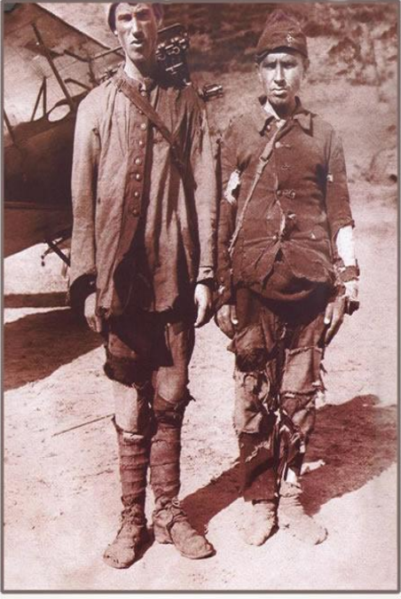
Year: 1915 Location: The airfield of the 1st Aviation Company at Gallipoli Their names? Mehmet, Mehmetik... Their only wealth is their life! What do they say to us? Look carefully and you will hear them shouting: Let our souls be a gift for our country. May their souls rest in eternal peace.

Çanakkale Savaşı olağanüstü bir kahramanlık destanıdır. 1915 yıllarının şartları içerisinde dünyanın en güçlü devletleriyle kahramanca, cengaverce, ölümüne bir savaş içerisinde bulunmuştu. Bu savaşın kaybedilmesi sadece bir savaşın kaybedilmesi değildi. Bu savaşın kaybedilmesi belki de devletin, milletin ebediyen yok olması, tarih sahnesinden silinmesi demektir. Ama, kahraman askerlerimiz bunu bize yaşatmadılar. Ünlü şairimiz Mehmet Akif ERSOY "Allah, bu millete bir daha İstiklal Marşı yazdırmasın." demiştir. İşte kahraman askerlerimiz yandaki resimde görülmektedir. İnşallah bir daha "Kurtuluş Savaşı" yapmak zorunda kalmayız.