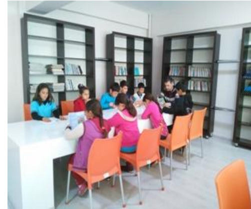
4 / A Sınıfı Öğr. okuma saatinde