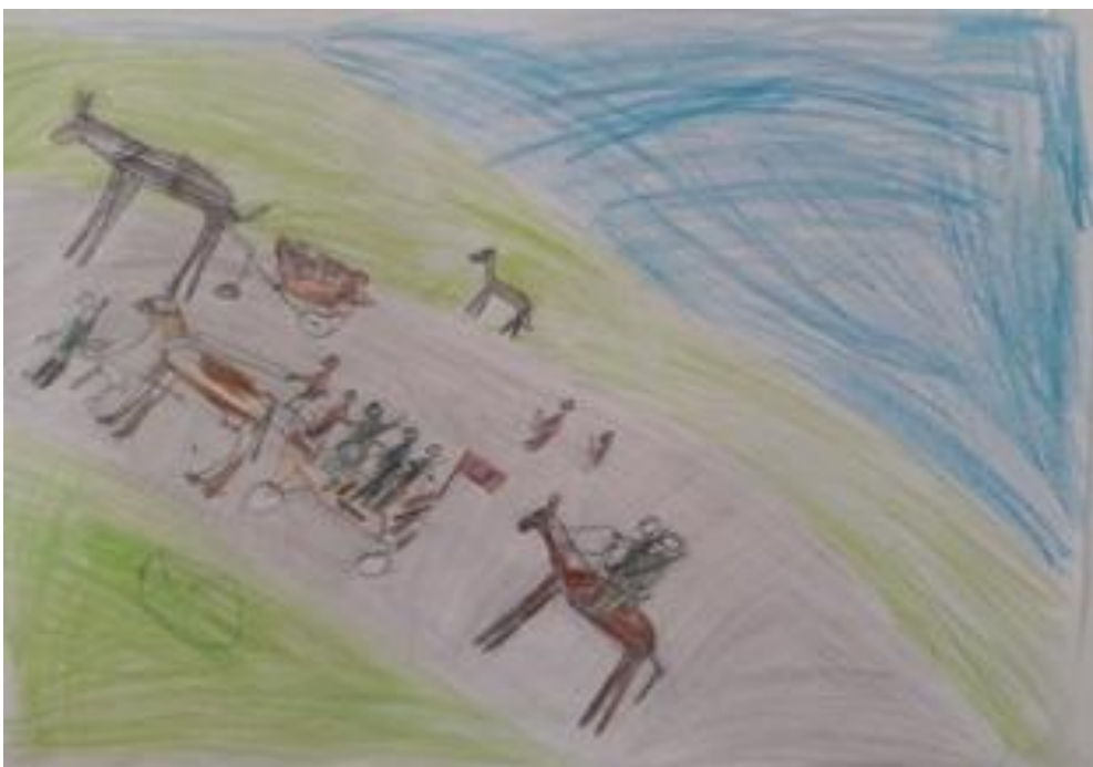
Resim yarışmamızın 1. si, Ayberk KORKMAZ 4 / A , Tebrikler ...