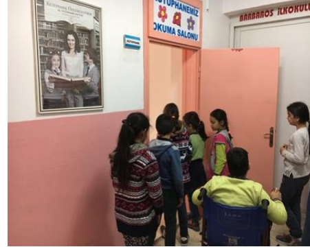
5 / B Sınıfı Öğrencilerimiz okuma saatindeler ...