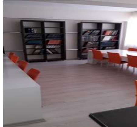
Kütüphanemiz yapılış esnasında

Yarı yıl tatilinde kütüphanemizi, okulumuzun 3. katından 1. katına aldık.Asansör olmadığından ve üst katta bulunduğu için ilkokul öğrencilerimiz yeteri düzeyde faydalanamıyorlardı.Artık, giriş katında tüm öğrencilerimiz rahatlıkla kullanabileceklerdir. / 06.02.2017