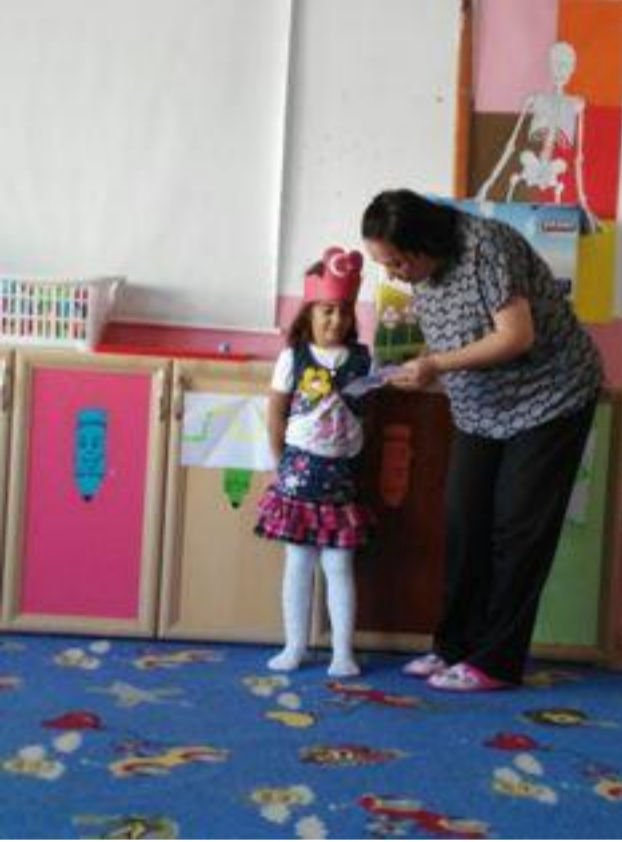
Anasınıfı - A