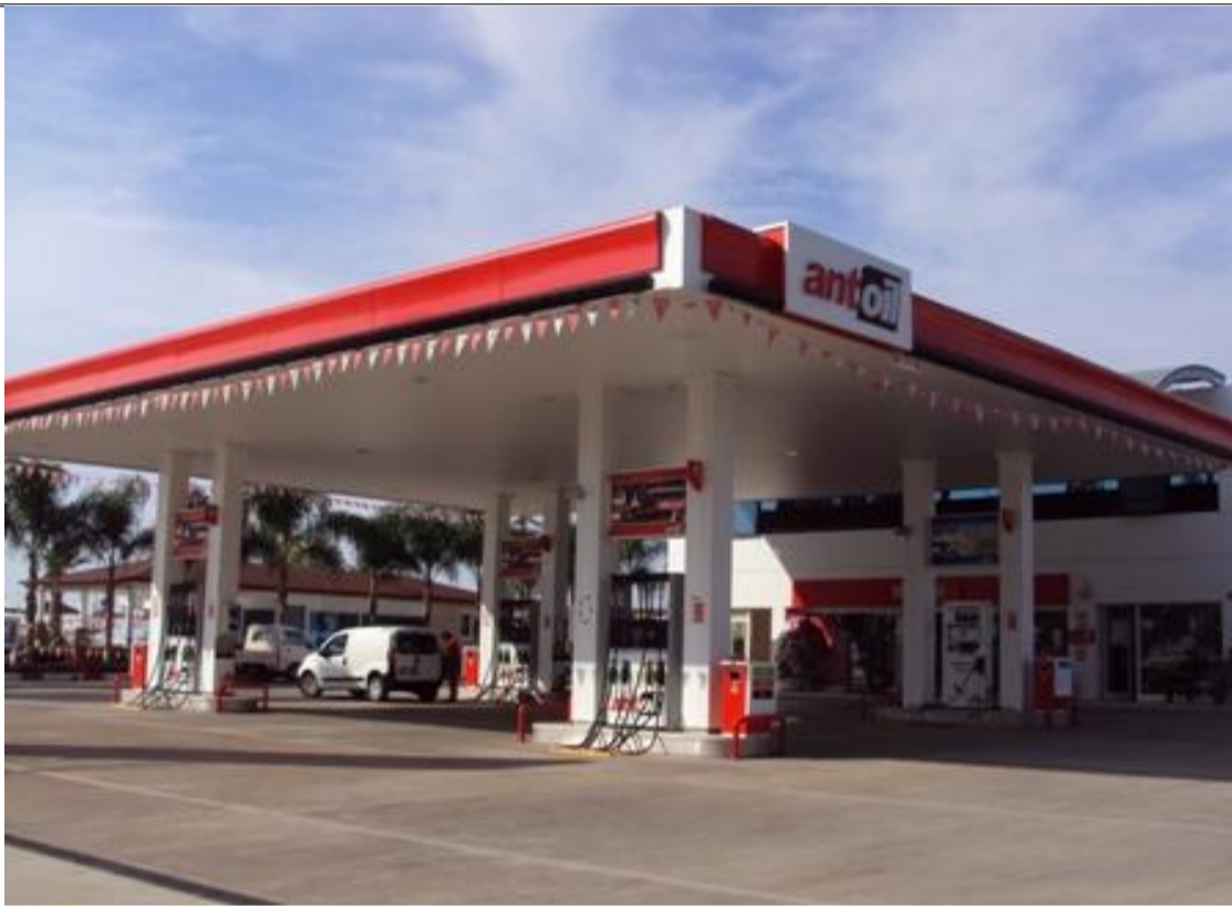
BAŞER PETROL / KUMLUCA / ANTALYA