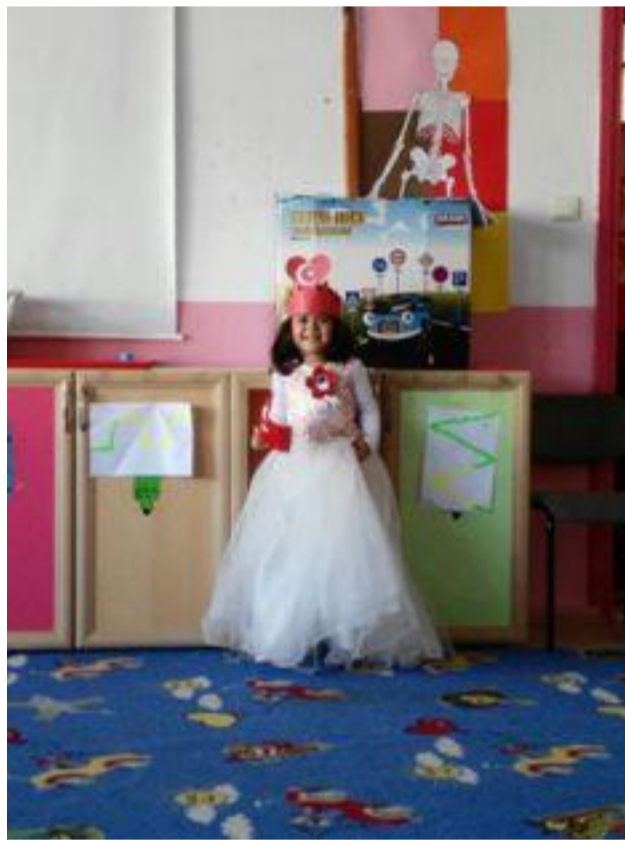
Anasınıfı – B