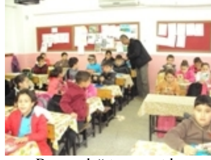
Broşür dağıtımını yaptık.