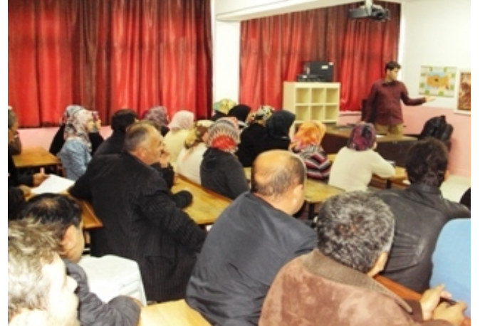
“ Çocuk İstismarı Semineri “ Yaptık / 12.2014