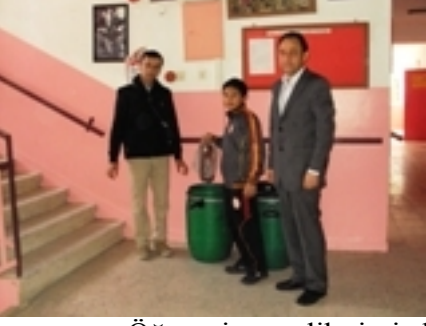
Öğrenci ve velilerimizden projemize katılım sağladık.