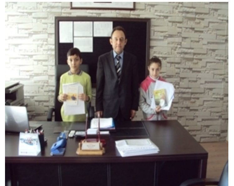
(Başarılı Öğrencilere Kitap Dağıtımı)

Antalya Büyükşehir Belediye Başkanımız Sn: Menderes TÜREL Bey tarafından okul 1.lerine gönderilen hediye, Okul 1. miz Huriye UÇTU'ya ödülü törenle takdim edilmiştir. Eğitime ilgilerinden, öğrencimize sağladıkları tatilden, ve hediyelerinden dolayı kendilerine çok teşekkür ederiz. / 12.02.2015