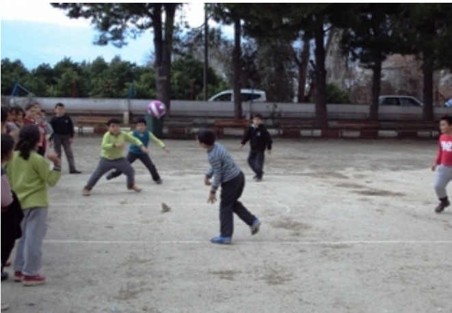
Geleneksel Çocuk Oyunları Hazırl. Başladı !