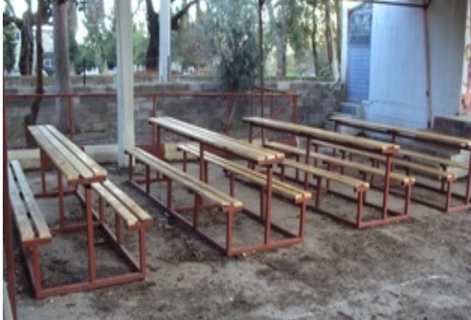
Öğrencilerimiz için piknik masaları yaptık !