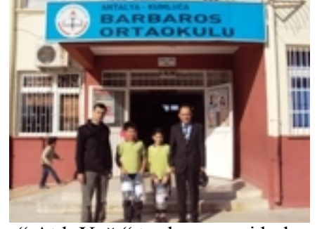
“ Atık Yağ “ toplamaya giderken ...