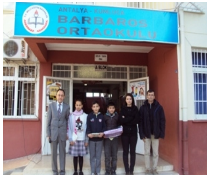
(Deneme Sınavı Ödül Töreni)